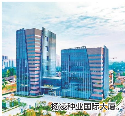
杨凌种业国际大厦。

如今,杨凌渭河湿地公园满目翠绿、风景秀美,渭河杨凌段良好的水质吸引了120多种野生水鸟在此聚集,有记录的国家Ⅰ级保护动物就有大鸨、白鹳、黑鹳等四种,国家Ⅱ级保护动物有鸳鸯、白琵鹭、反嘴鹈等,更有朱鹮这种国宝级鸟类饮水、觅食、嬉戏。昭示着生物多样性保护成效明显,“山水林田湖草沙”一体化生态治理成效在渭河杨凌段得到充分体现。(据《陕西日报》)