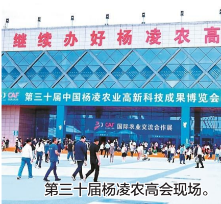
第三十届杨凌农高会现场。