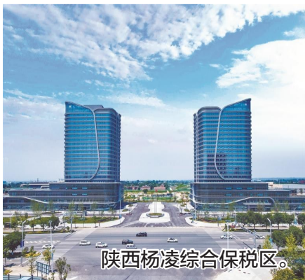
陕西杨凌综合保税区。