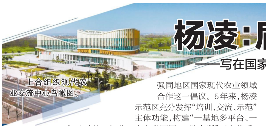
上合组织现代农业交流中心鸟瞰图。