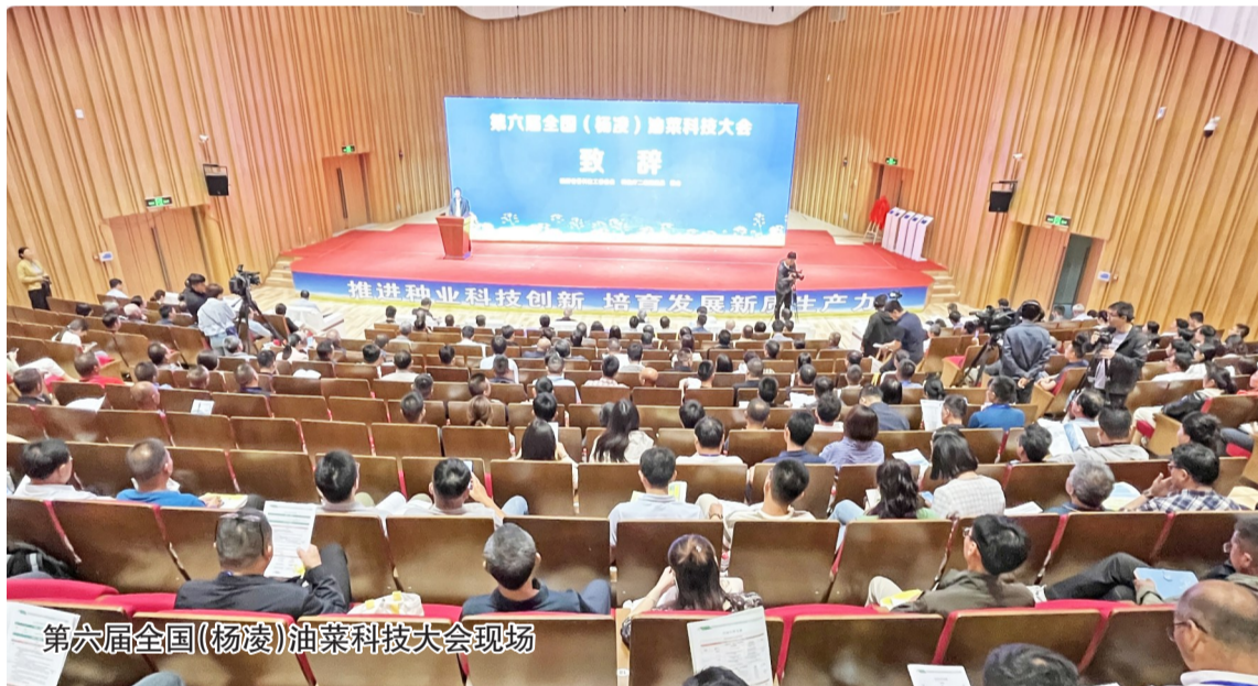
第六届全国(杨凌)油菜科技大会现场