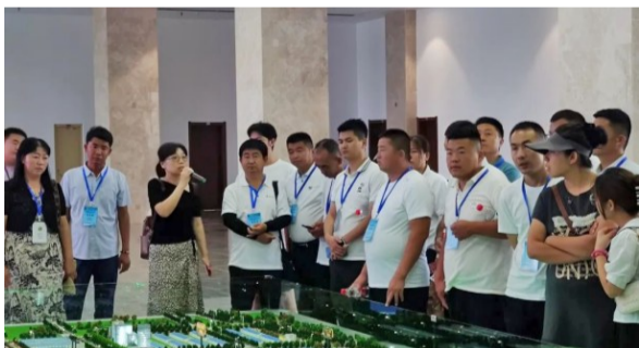
▲头雁学员参加现场教学。

加大财政金融扶持力度。 聚焦“头雁”融资难问题,发挥财政金融政策优势,榆阳区“三农”领域年投入资金15亿元以上,支持“头雁”申报民营经济发展专项资金,用于更新技术设备、创建品牌、技术推广等。开展“头雁”综合考评,对带动能力评定为一类、二类、三类的“头雁”,区财政每年分别给予1.2万元、0.7万元、0.5万元奖补,同时享受最高500万元、300万元、100万元的创业担保免息贷款。区财政向农商行注资1000万元设立风险补偿基金,撬动银行信贷1亿元,畅通“头雁”贷款融资渠道,鼓励“头雁”申请小额信贷、惠农e贷用于生产经营发展。