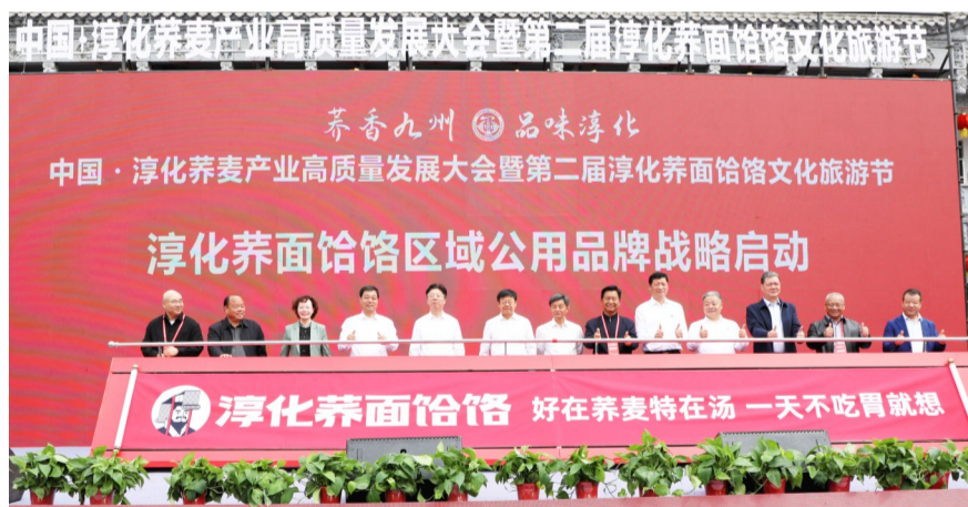
淳化荞面饸饹区域公用品牌战略启动仪式

近年来,淳化县坚持把荞麦产业作为县域经济高质量发展的首位产业,先后成立荞麦产业发展领导小组,以县政府一号文件印发荞麦产业发展实施意见,出台荞麦产业发展扶持办法,列支2000万元扶持