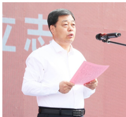
中共淳化县委书记郭立志致辞