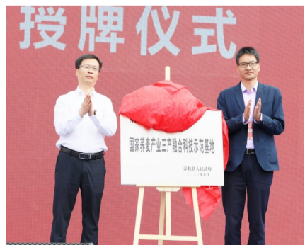
国家荞麦产业三产融合科技示范基地揭牌