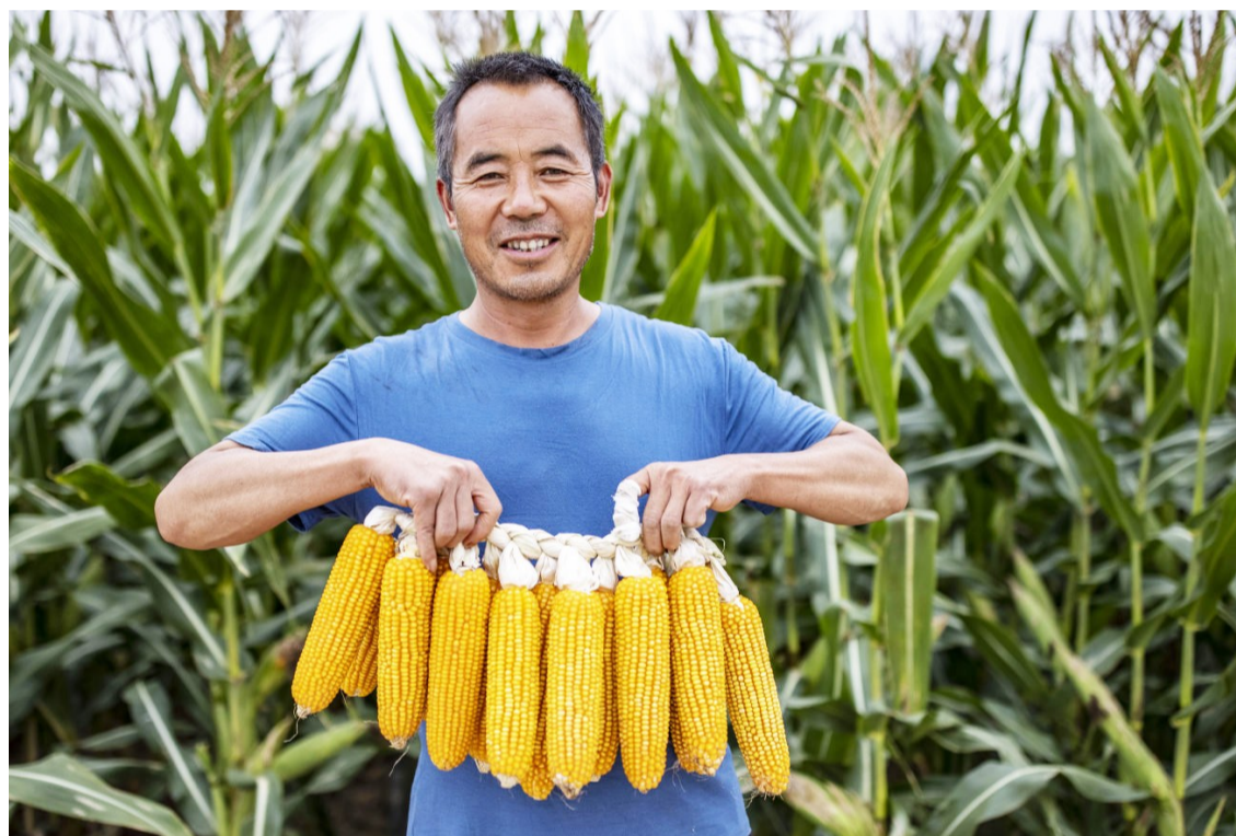
▲农高会田间展上工作人员展示玉米新品种。

9月15日，以“创新·合作与粮食安全”为主题的第29届杨凌农高会在陕西杨凌如约而至。今年农高会，对于广大农民群众来说，是一场不同以往的盛会，参会群众不仅可以在展馆内参观各种“新奇特”，还能在田间地头现场学习取经。围绕良种繁育、节水灌溉、土壤改良、智慧农业等领域设置的西北农林科技大学杨凌玉米实验基地、杨凌智慧农业示范园、良科种业基地、秦农现代农