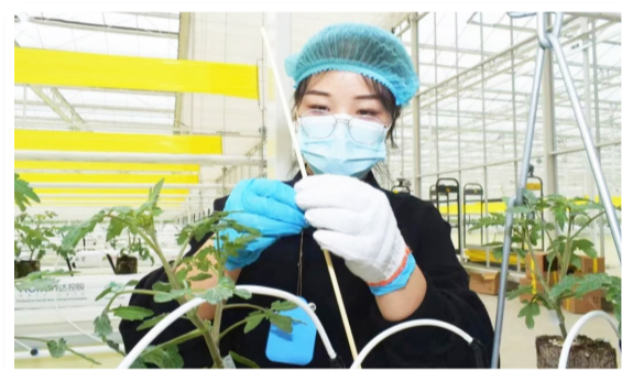
农高会田间展上智慧农业吸睛无数。