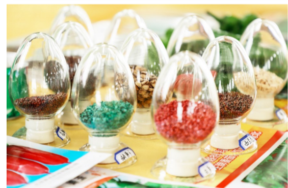
展示的农作物新品种为粮食安全植入“科技芯”。